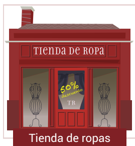
Tienda de ropas